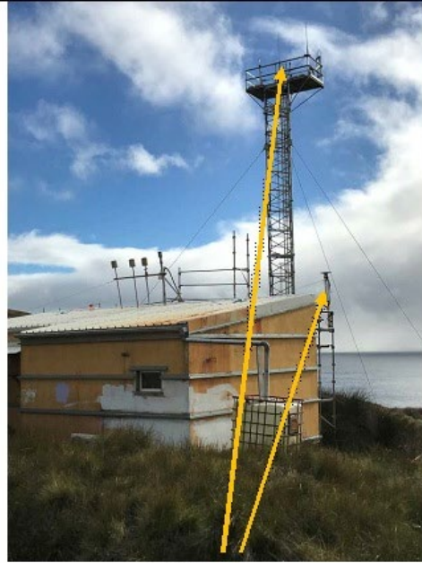
Les 2 sites de tests