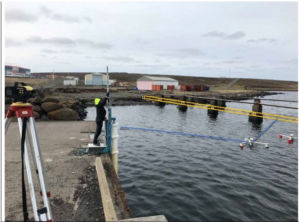
Nivellement et proposition de va et vient (en jaune) le long de la passerelle pour déployer la bouée GNSS