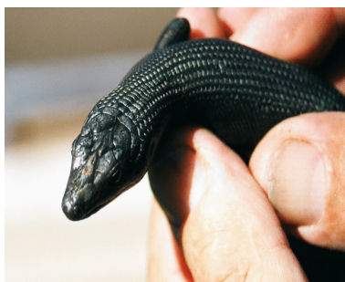
Et le copain de JLM (Je Lézarde Méchamment)