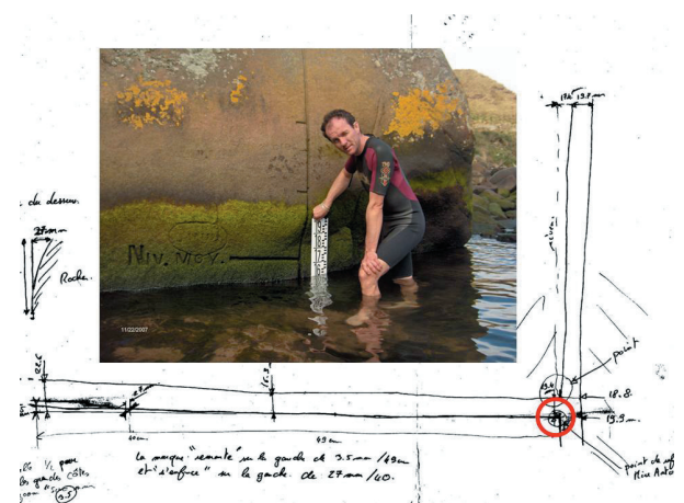
Photo 2. Niveau moyen de la mer gravé dans un rocher lors de l'expédition de 1874.