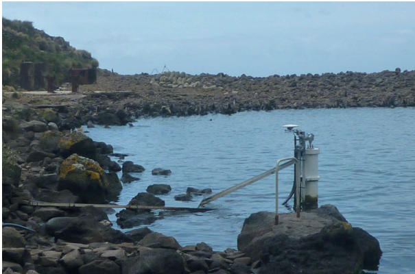
Photo 3a. Station marégraphique et l'antenne du GPS permanent. Au fond, la plage de galets est celle où fut installé l'observatoire astronomique par l'expédition d'E. Mouchez en 1874.