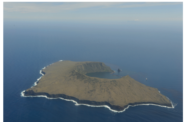
Photo 1. Le cratère de Saint-Paul dans l'Océan Indien vu du ciel.

liers d'années (Photo 1). Avec l'île d'Amsterdam située à quelque 100 km au nord, Saint Paul représente une des rares terres émergées d'un vaste plateau volcanique sous-marin situé le long de la dorsale sud-est indienne (Doucet et al. , 2003). Les îles Saint-Paul et Amsterdam ont un climat océanique relativement doux influencé par l'anticyclone subtropical et les vents d'est connus sous le nom des quarantièmes rugissants. Dès 1874, l'île de Saint-Paul fut l'objet d'une expédition scientifique. Les mesures du niveau de la mer prises alors permirent le calcul d'un