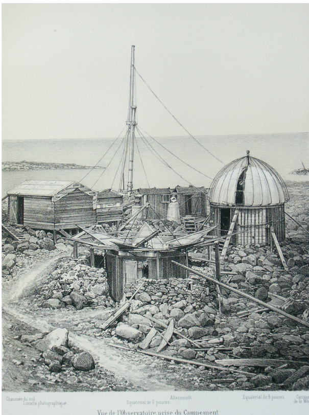
Photo 3b. L'observatoire marégraphique installé fin XIX e.