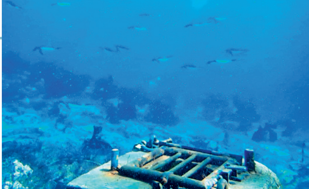
Marégraphe immergé, le capteur de pression est protégé par une grille.

Les données transmises par le marégraphe immergé sont scrutées toutes les deux minutes et envoyées au LEGOS (Laboratoire d'Etudes en Géophysique et Océanographie Spatiales). Ainsi, le programme NivMer, aussi présent dans les îles subantarctiques françaises, participe au réseau mondial d'observation du niveau de la mer (GLOSS : Global seaLevel Observation System).