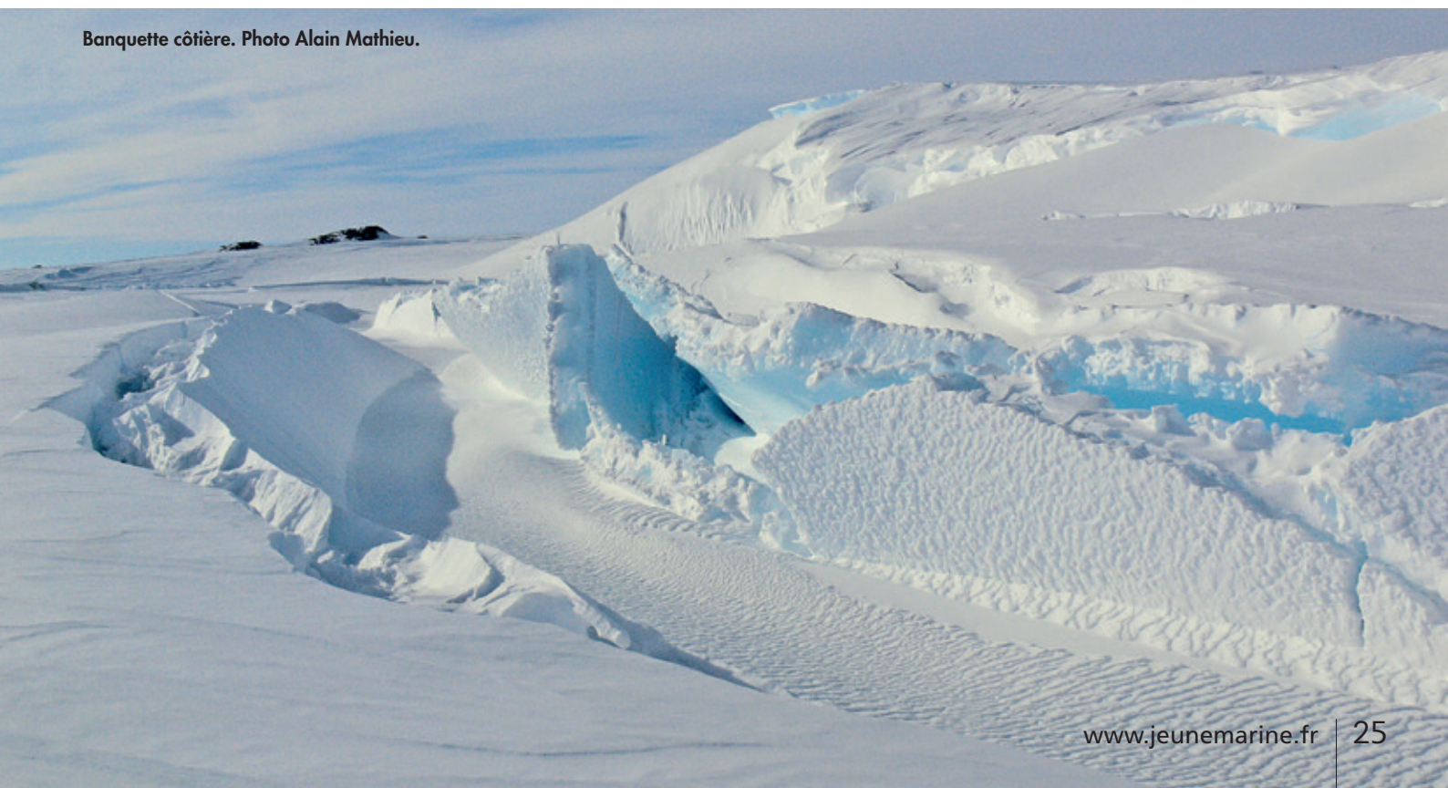
Banquette côtière.

Pour suivre mon hivernage à la centrale énergie-eau de la base de Dumont d'Urville, rendez-vous sur le site chroniquesgivrees.ta64.tf .