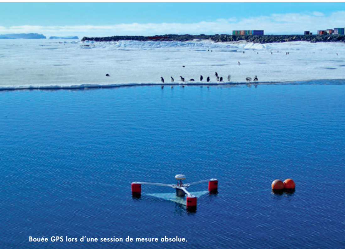
Bouée GPS lors d'une session de mesure absolue.

En Antarctique comme ailleurs, la marée est un phénomène de première importance pour les sites côtiers. Sur l'île des Pétrels en Terre Adélie, alors même que la banquise a pris en étau la terre, les variations du niveau de la mer sont visibles et mesurées. Que personne ne dise que la banquise est une mer gelée sans mouvement !